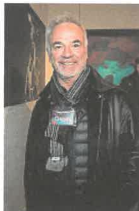
Guru Sam Nicholson ha firmato, tra gli altri, gli effetti speciali di «Star Trek II»