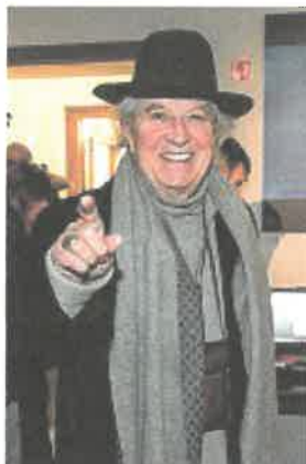
Premio Oscar Il maestro Vittorio Storaro con cappello e lunga sciarpa