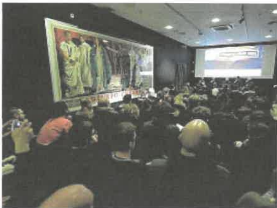
Sala Deluxe Gran pienone per gli incontri e le masterclass in programma